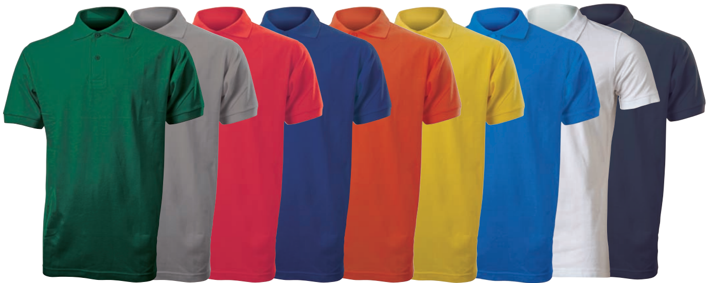
Verde Grigio Mel Rosso Blue Navy Arancio Giallo Blue Royal Bianco Nero