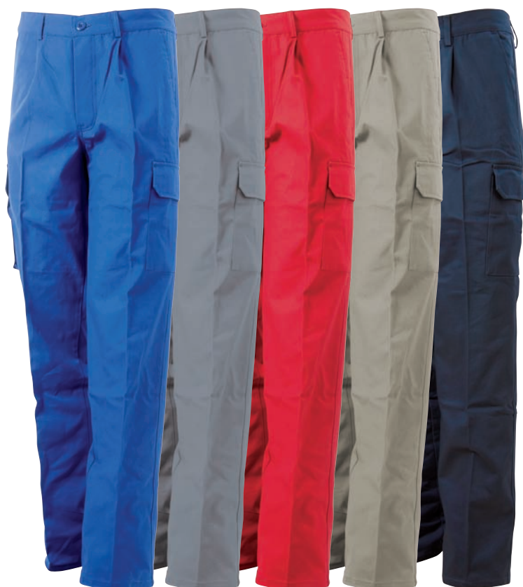
Blu royal Grigio Rosso Kaky Blue Navy