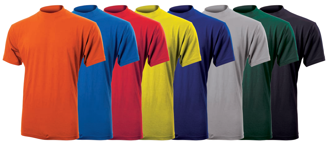
Arancio Blue Royal Rosso Giallo Blue Navy Grigio Mel. Verde Nero