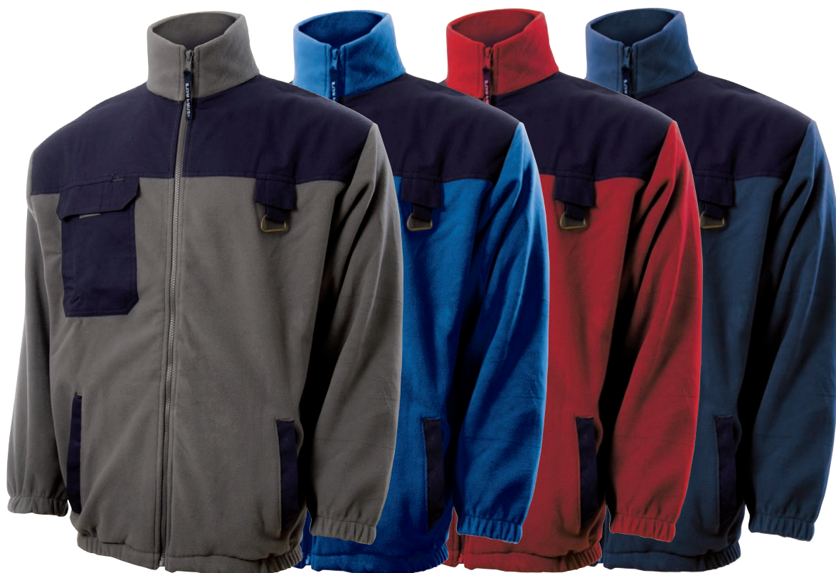
Grigio /Blue Navy